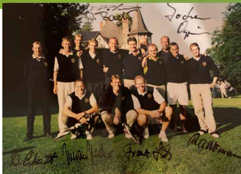
Erinnerung an einen großen Erfolg: Das Foto zeigt das Siegerteam der DMM 2000.

Im vergangenen Jahr wurde der Golf Club am Reichswald 60 Jahre alt. Statt größerer Feierlichkeiten fand coronabedingt nur ein internes Geburtstagsturnier statt. Doch aufgeschoben ist nicht aufgehoben. Hoffnungsvoll sieht der Club der neuen Saison entgegen. Was viele nicht wissen: Zusammen mit dem GC Bad Kissingen, dem Münchener GC, den Golfclubs Feldafing und Augsburg gehört der Golf Club am Reichswald zu den zehn ältesten Clubs in Bayern. Man begann mit 9 Loch und erweiterte 1973 auf 18 Spielbahnen. Golfarchitekt Bernhard von Limburger, seinerzeit einer der klangvollsten Namen im Golfplatzbau, legte inmitten des Reichswaldes von Anfang